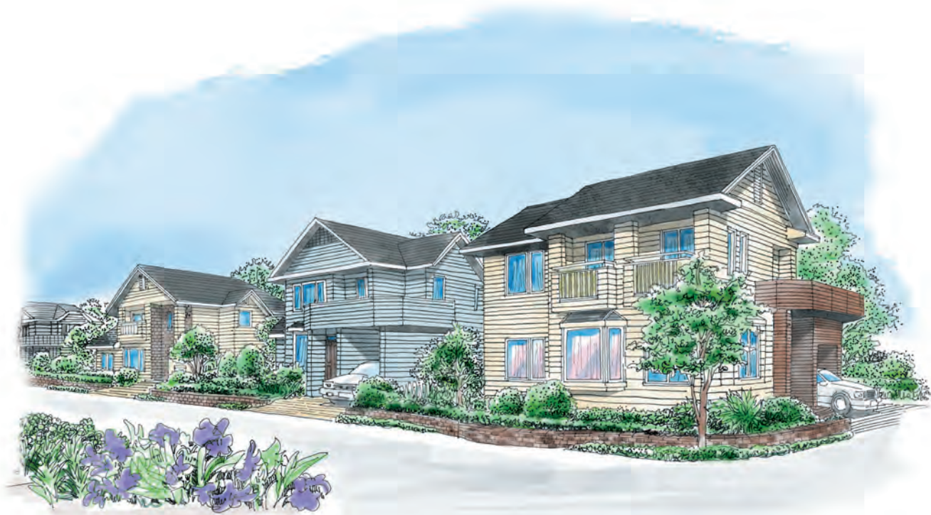
※街並みイメージイラスト