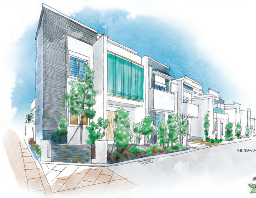
※街並みイメージイラスト