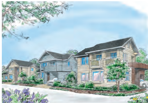
植栽がある街並み