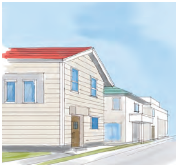
植栽がない街並み